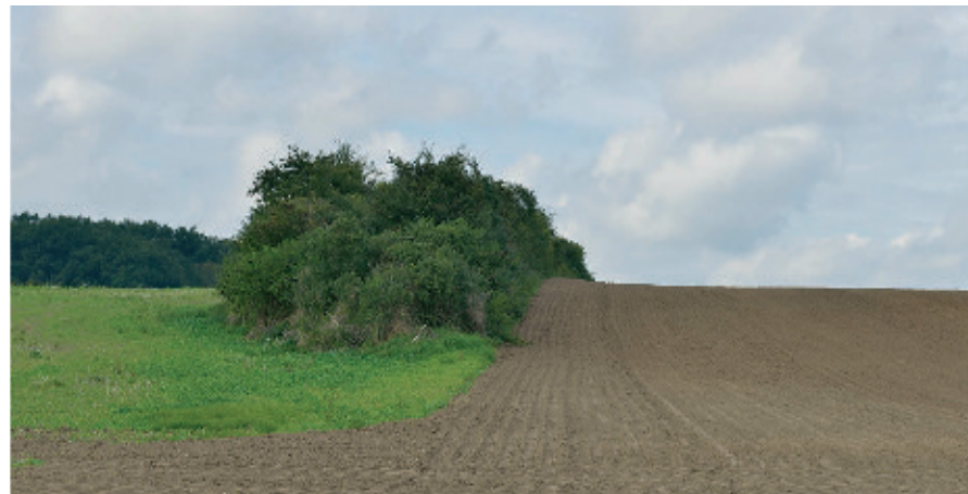
„Sichten 5“, 2015, 61x224 cm