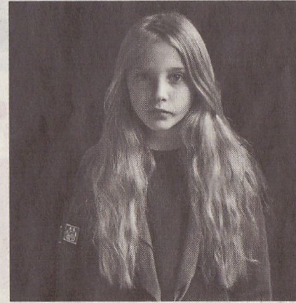
Gesichter eines Landes. Nelli Palomäki porträtiert halbwüchsige Kinder.

schen Films aufwartet. Mit einer Landschaft, so eintönig wie sie eben ist im Norden: ein Wald, ein Weg, vielleicht ein Feld, manchmal ein See. Und Licht: hell erleuchteter Schnee, die Schaumkrone einer Welle, ein altes Auto, alles umhüllt von Nacht. Die Bilder strömen einen Stillstand aus, wie er schöner kaum sein kann, ein Dunkel, das den Blick nach innen lenkt, in das man sich einfühlen kann und das nach und nach wieder Licht enthüllt.