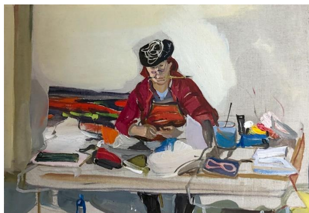
Bei der Arbeit, Öl auf Leinwand, Ventspils/Lettland 2019 © Neomilla Medvedeva