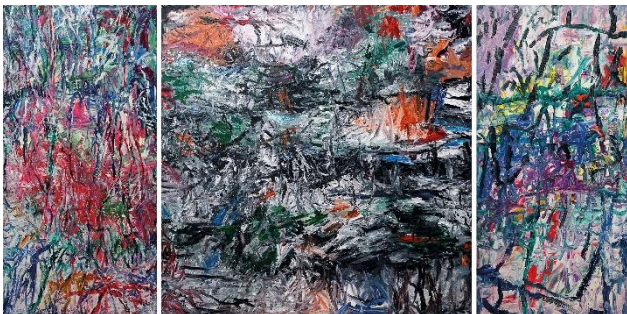
Inferno II (1-3) 2021 Acryl auf Leinwand 100 x 200 cm